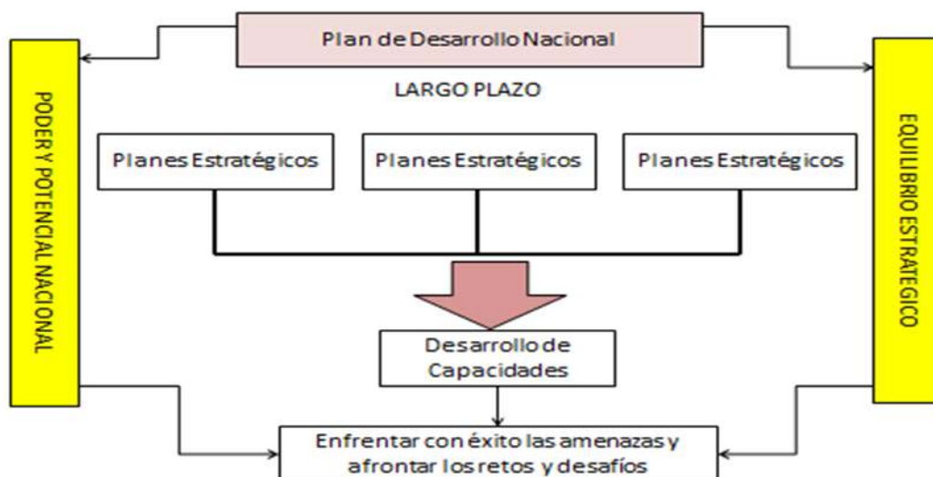
Gráfico: Fuente propia

pensamientos nace una pregunta: ¿Es esta una relación hipócrita o más bien una relación de interés?